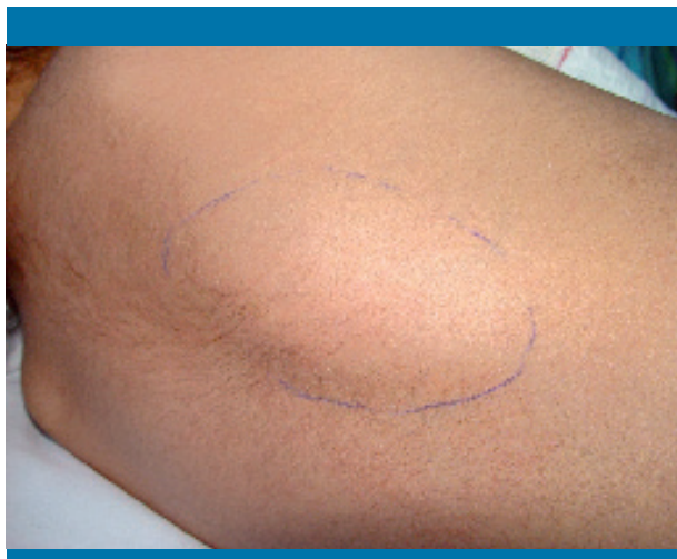
Figura 1. Formación paraespinal derecha