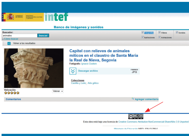
Figura 3. Resultado de una búsqueda de imágenes en el Banco de imágenes y sonido del INTEF