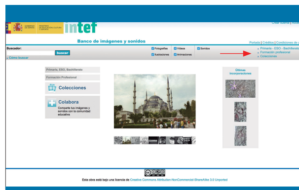
Figura 2. Banco de imágenes y sonidos del Instituto Nacional de Tecnologías Educativas y de Formación del Profesorado (INTEF) del Ministerio de Educación, Cultura y Deporte

genes/web/) para ser utilizadas con fines únicamente educativos. En este banco se puede acceder a las imágenes que se muestran tanto en la parte derecha superior como en la parte izquierda de la zona central. Las imágenes están clasificadas en tres epígrafes (Primaria-ESO-Bachillerato/Formación profesional/Colecciones). También tiene un buscador que permite introducir texto para encontrar una imagen, pudiendo restringir la búsqueda a fotografías, ilustraciones, vídeos, animaciones y sonido (figura 2).