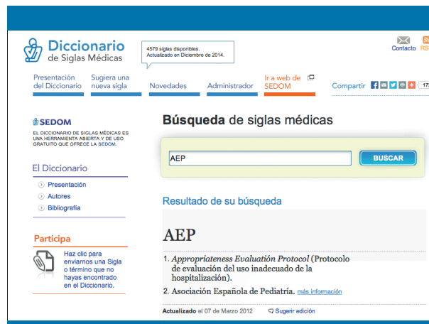
Figura 2. Resultados de una búsqueda sobre las siglas AEP en el Diccionario de Siglas Médicas de Yetano Laguna y Alberola Cuñat, accessible en el sitio web de la Sociedad Española de Documentación Médica-SEDOM ( http://sedom.es/diccionario/ )