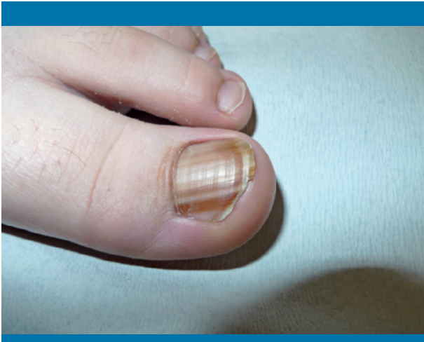
Figura 1. Imagen clínica con lesiones pigmentadas lineales en la uña