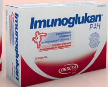
30 CÁPSULAS CN 161318.9