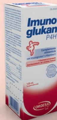
SUSPENSIÓN ORAL 120 ML CN 161317.2