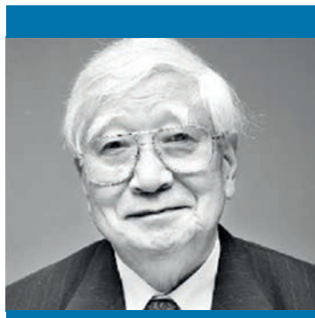
Figura 2. Fotografía de Tomisaku Kawasaki, médico japonés que describió, en 1967, varios casos de erupción cutánea, fiebre y vasculitis en niños, enfermedad conocida hoy como enfermedad de Kawasaki